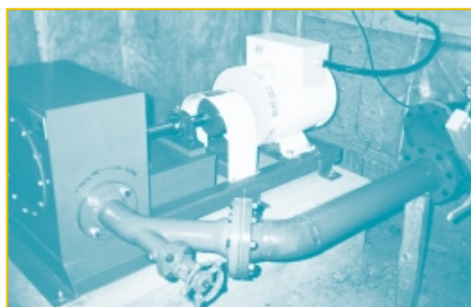
▲ Turbine Pelton directement couplée à une génératrice synchrone de 8 kW

systemes à faible débit (p. ex., conduite forcée, turbine, prise d'eau et déversoir) sont plus petits et moins coûteux.